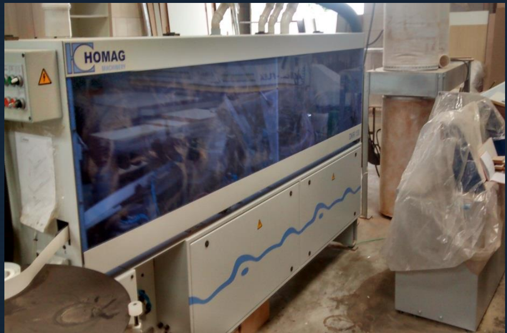
Case Vila Madera